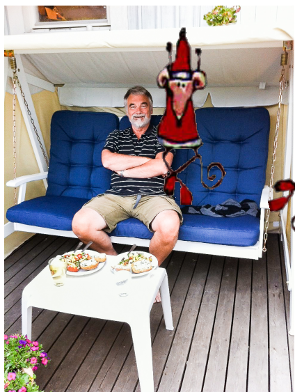
Vi blev pensionärer och köpte oss en hammock.