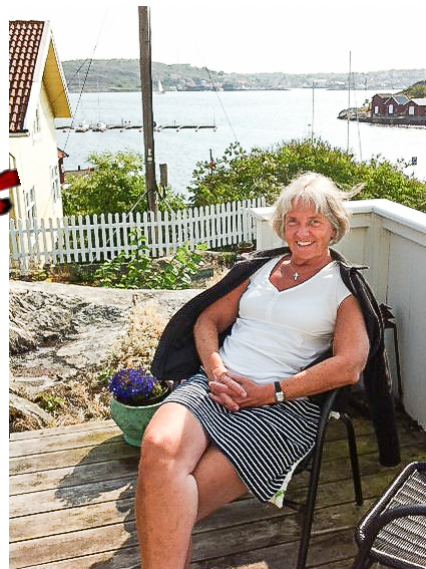
Sköna dagar på Hälsö.