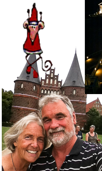
Augustisemester på Rügen och i Lübeck.